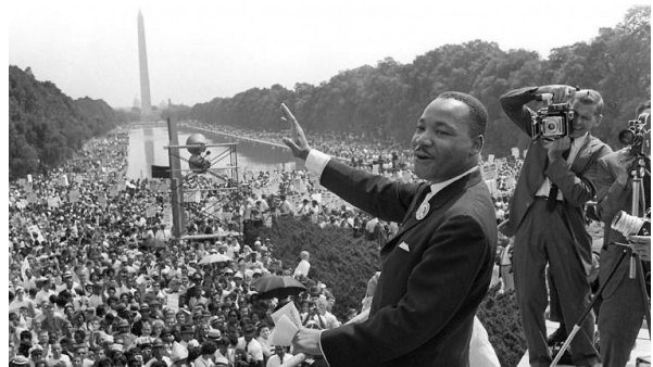
Légende: Le défenseur des droits civiques, Martin Luther King, le 28 août 1963 à Washington