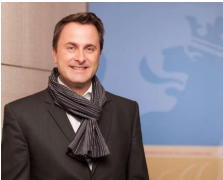
Légende: Xavier Bettel, Premier ministre